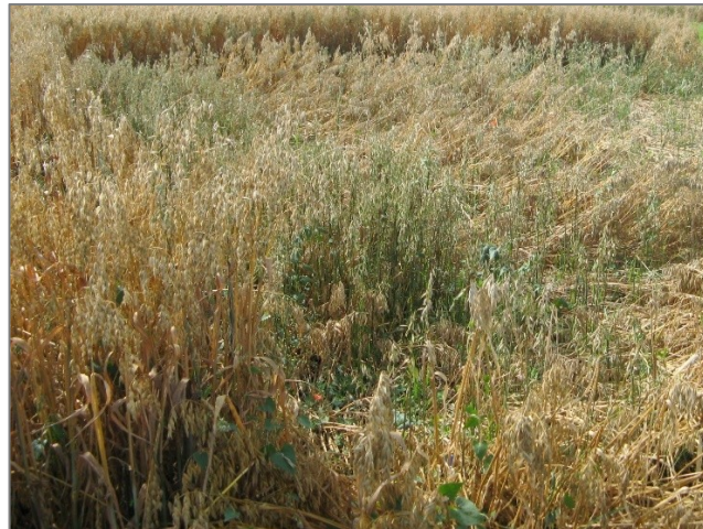
Abb. 7: Reifeverzögerung durch Lager