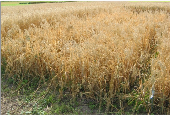
Abb. 6: Halmknicken