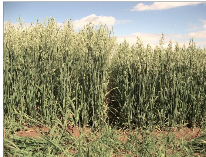
Abb. 4: Unterschiedliche Pflanzenlängen Bilder - Fortsetzung