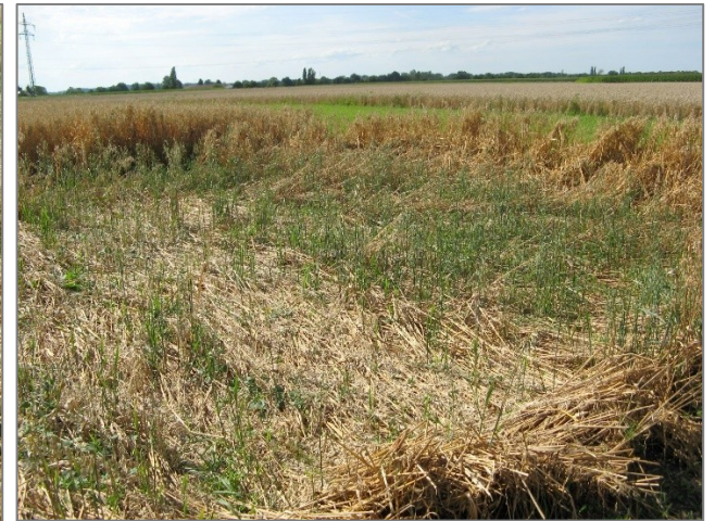
Abb. 8: Erneuter Austrieb nach starkem Lager