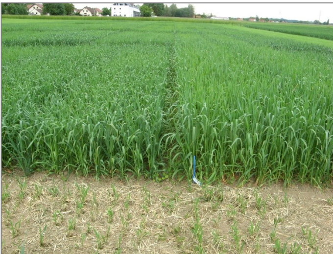
Abb. 3: Sorten mit unterschiedlicher Massenbildung in der Jugend