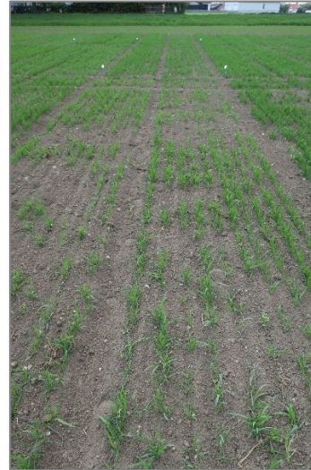
Abb. 2: Schlechter Auflauf wegen geringer Keimfähigkeit dadurch geringer Bodendeckungsgrad