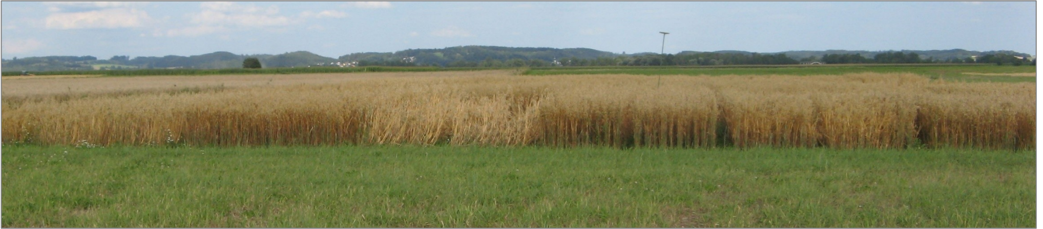
Abb. 5: Beispiel für eine Sorte mit stärkerer Neigung zu Lager