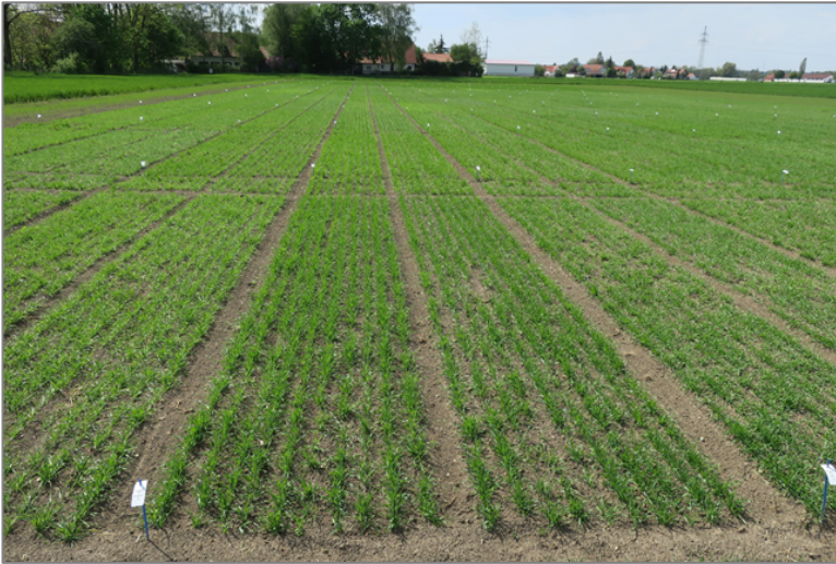
Abb. 1: Gelingene Ansaat eines Haferversuches