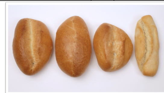
Bewertung 40 11 23 Semmel aus Futterweizen