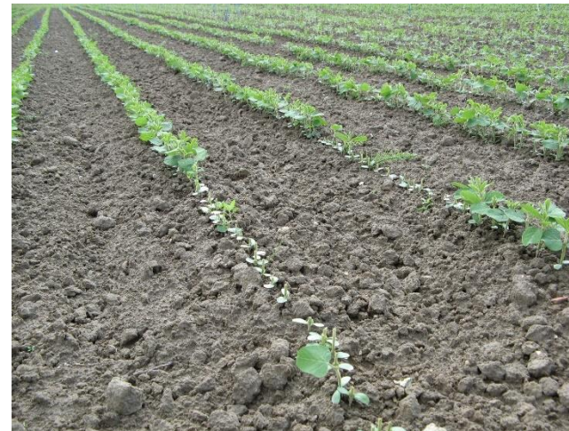
Abbildung 4: Wildschäden, Quelle: Eigene Aufnahme Florian Jobst