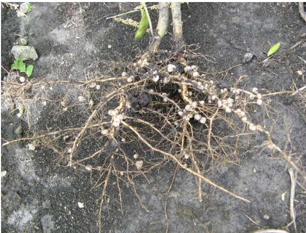
Abbildung 3: Knöllchenbakterien