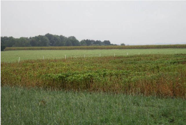
Abbildung 1: Sortenversuch Soja, Quelle: Eigene Aufnahme Andrea Winterling