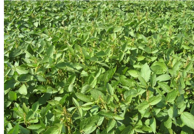
Abbildung 2: Soja