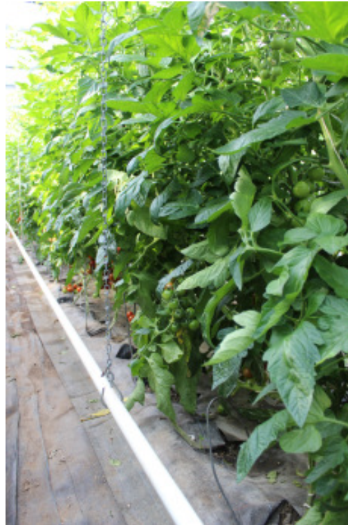
'Annamay F1' auf 'Maxifort F1'