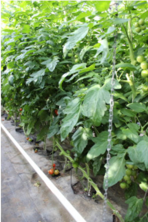
'Annamay F1' auf 'Estamino F1'

Im Ertrag führen die Tomaten-Unterlagen Eperador , Kaiser, Maxifort, Fortamino, Optifor und Estamino gleichwertig, im Geschmack liegen Spirit und Annamay auf eigener Wurzel vorne