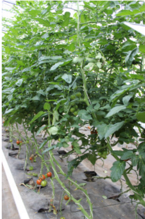
'Annamay F1' auf 'Spirit F1'