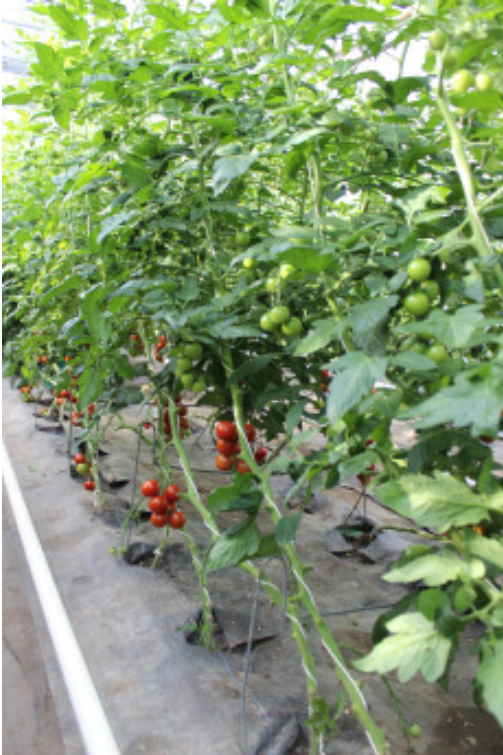
'Annamay F1' auf 'Annamay F1'

Fotos aller Unterlagen vom 16.06.2016