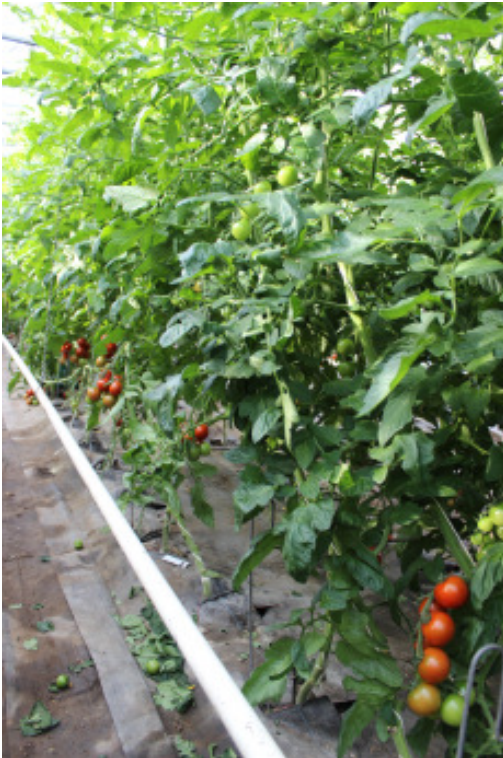
'Annamay F1' auf 'Fortamino F1'

Im Ertrag führen die Tomaten-Unterlagen Eperador , Kaiser, Maxifort, Fortamino, Optifor und Estamino gleichwertig, im Geschmack liegen Spirit und Annamay auf eigener Wurzel vorne