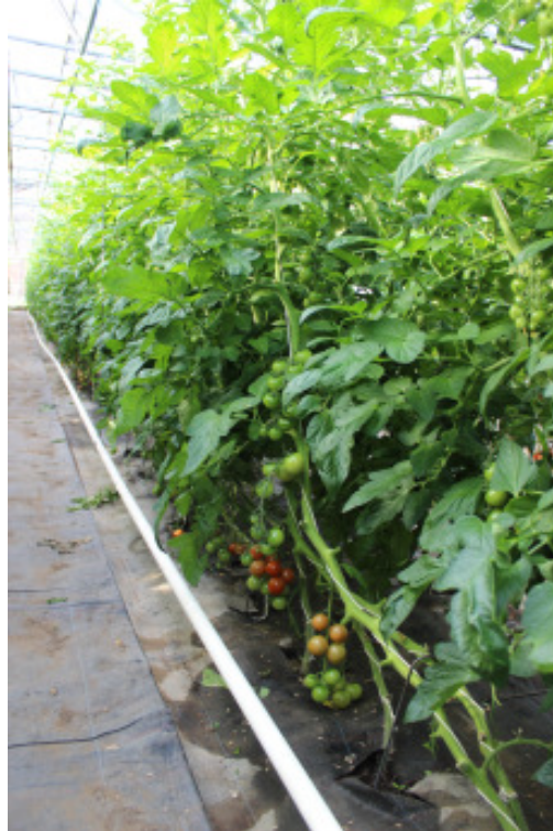
'Annamay F1' auf 'Emperador F1'