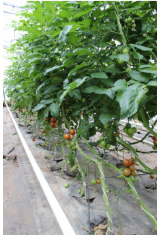
'Annamay F1' auf 'Optifort F1'