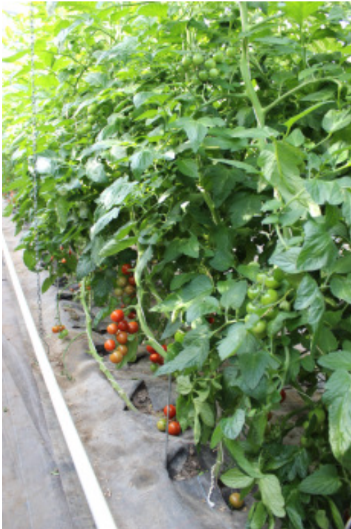
'Annamay F1' auf 'Kaiser F1'

Im Ertrag führen die Tomaten-Unterlagen Eperador , Kaiser, Maxifort, Fortamino, Optifor und Estamino gleichwertig, im Geschmack liegen Spirit und Annamay auf eigener Wurzel vorne