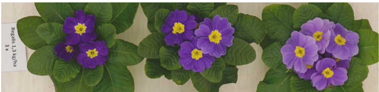
Foto 5: Regalis Plus 1,5 kg/ha 3 Behandlungen KW 51, 52, 2, Knospen Farbe zeigend, erste Blüten offen (3 Wochen vor Vollblüte)

Wdh. 2 (schattiger Ber.) sehr vereinzelt leichte Aufhellung