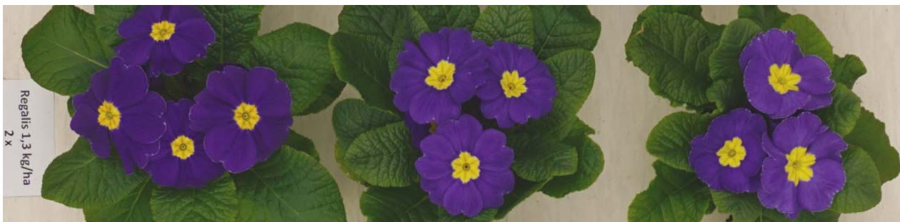
Foto 4: Regalis Plus 1,5 kg/ha 2 Behandlungen KW 51 und 52, erste Knospen zeigten Farbe (5 Wochen vor Vollblüte)

Wdh. 1 (heller Bereich) leichte Aufhellung