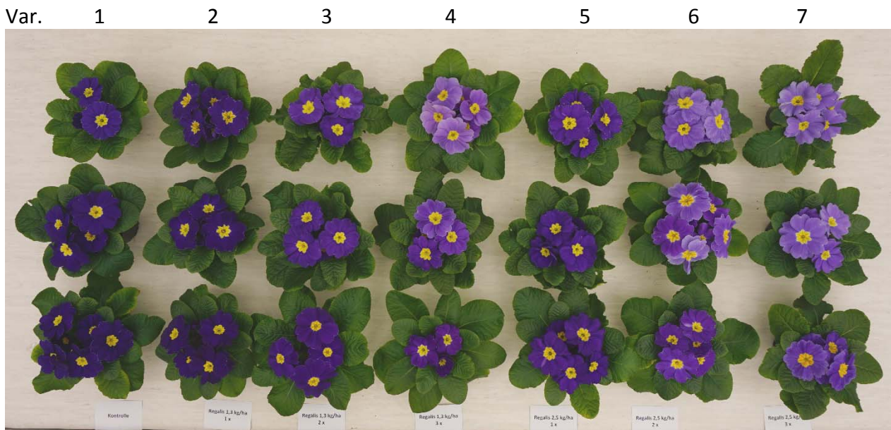
Foto 1: von links nach rechts, senkrecht jeweils drei Pflanzen einer Variante mit typischen Farbabstufungen: Kontrolle - Regalis Plus 1,5 kg/ha 1x, 2x, 3x, Regalis Plus 2,5 kg/ha 1x, 2x, 3x