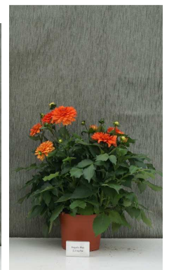
Regalis Plus 2,5 kg/ha

Fotos 8-11: Bei der stärker wachsenden 'Melody Deep Orange' wirkte Regalis Plus am stärksten, die Blüten waren leicht aufgehellt.