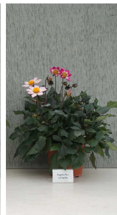
Regalis Plus 1,5 kg/ha