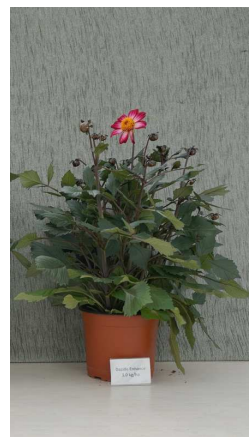
Dazide Enhance 3,0 kg/ha