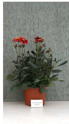
Dazide Enhance 3,0 kg/ha