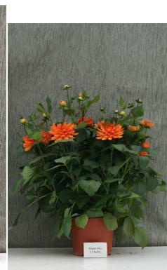
Regalis Plus 1,5 kg/ha