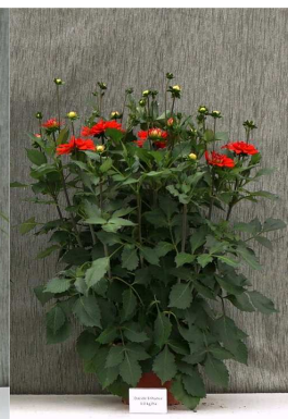
Dazide Enhance 3,0 kg/ha