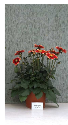
Regalis Plus 1,5 kg/ha

Fotos 5-7: 'Dahlgria Orange Yellow Tip' reagierte sehr gut auf Dazide Enhance und Regalis Plus.