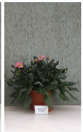
Regalis Plus 2,5 kg/ha

Fotos 1-4: 'Dahlegria Magenta Bicolor' mit dichtem Aufbau und kompakterem Wuchs durch Behandlungen mit Dazide Enhance oder Regalis Plus. Durch Regalis Plus sind frühe Blüten aufgehell. Die Bonzibehandlungen hatten wenig Einfluss auf die gemessene Pflanzenhöhe.