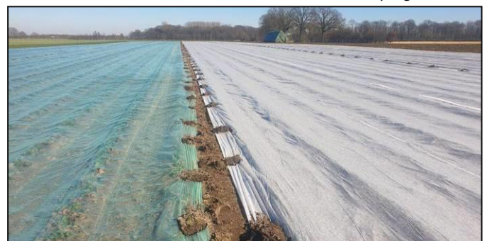
Lochfolien- und Vliesabdeckung bei Erdbeeren im Flachenbau