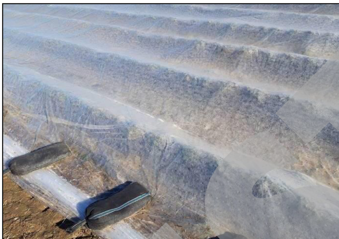
oben: Doppelabdeckung mit Vlies und Lochfolie bei Erdbeeren auf Damm.