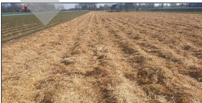
Aufbringen der Strohverspätung bei Erdbeeren